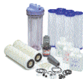
Kit préfiltre & entretien